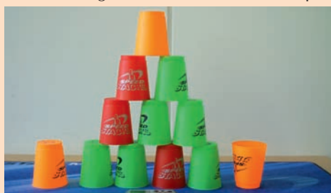
Gestapelt als 1 - 10 - 1-Figur

Nun den rechten Dreierturm neben den Linken schieben: