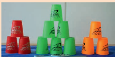
Gestapelt als 3 - 6 - 3