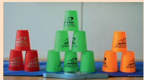
Gestapelt als 3 - 6 - 3