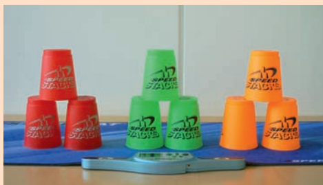
Gestapelt als 3 - 3 - 3